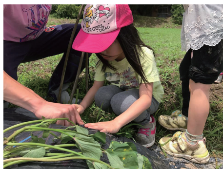
若草工場（ある蔵）産廃1