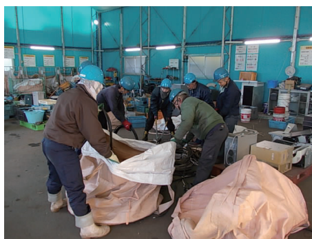
若草工場（ある蔵）産廃3