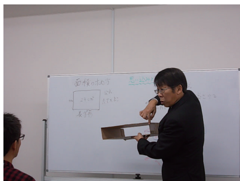
教育支援（そんとく塾）授業1

○つまづきは竹の節のようなものです。しかし、節から伸びるのか、節から折れるのかは自分次第です。自立、自律、而立。自分で立ち、自分を律し、而して（そうして）はじめて自立更生ができ、人としてもう一度甦ることができると思います。学びなおすこと学び続ける事。そこに新たな未来がある。私たちは、そんな志をもった方を応援します。