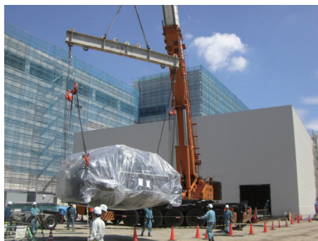
200tクレーンを使用して冷凍機を トレーラーから荷卸し作業中

私たちが行っている仕事は日々現場状況が変わる中いろんな重機、機械、道具を使用して作業を行います、また数多くの免許も必要です、職長教育、玉掛、ユニック車、フォークリフトの運転免許、足場の組立解体作業、etc。グループ毎に現場へ行き作業を行います、安全かつスムーズに仕事を進めるにはリーダーを初めとして全員の協力、団結が必要になります、危険に際しては最終的に自分の身は自分で守る事がもっとも重要です。やりがいがある仕事です、奮って応募下さい。