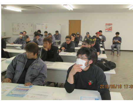
社内協議会(毎月第3水曜日開催) ・安全に対する教育や会社を少しでも より良くする為の協議会です。