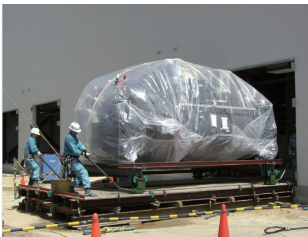
冷凍機(重量25t)を建物内へ搬入中