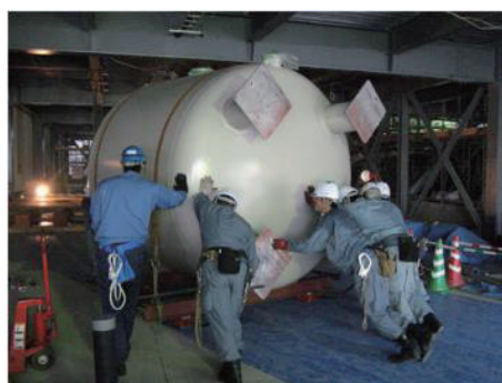
丸型のタンクを転倒しないように 固定して建物内に搬入する作業