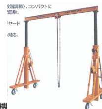
現場で使用する機