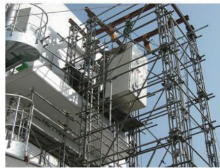
四角支柱を1階~4階まで組立、 電気盤を1階~4階へ搬入する作業