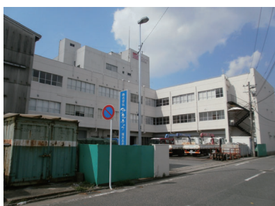
弘進テック福岡支店の全景