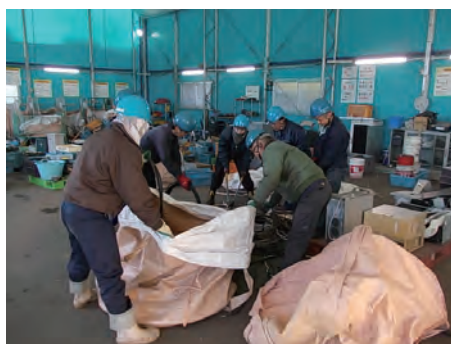
若草工場（ある蔵）産廃3