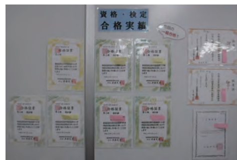
情報検定合格証書