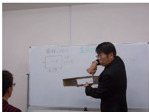
教育支援（そんたく塾）授業1

○つまづきは竹の節のようなものです。しかし、節から伸びるのか、節から折れるのかは自分次第です。自立、自律、而立。自分で立ち、自分を律し、而して（そうして）はじめて自立更生ができ、人としてもう一度甦ることができると思います。学びなおすこと学び続ける事。そこに新たな未来がある。私たちは、そんな志をもった方を応援します。