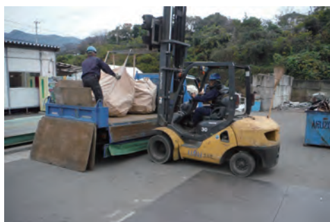
若草工場（ある蔵）産廃1