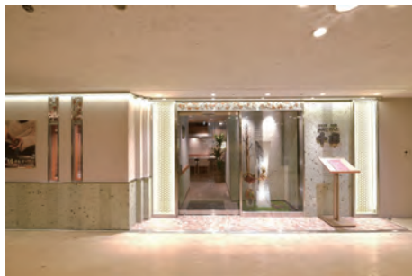
ふれじでんと千房都ホテル外観