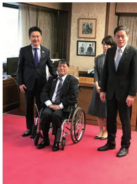
法務大臣長谷川議員と (H31.1.16.)