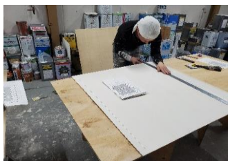
資格取得のため練習中

「Independence」《インディペンデンス》周囲の意見や指示に頼らず、自分自身の考えを軸として問題に取り組む。を企業理念を掲げ、将来独立できるような人材を育てています。一軒家や、マンション等の建物の塗装がメインですが、公共工事を受注し、橋の塗り替えなどを行っています。社員の平均年齢が29歳と若く、活気があります。一緒に働いてくれる仲間を募集しています。