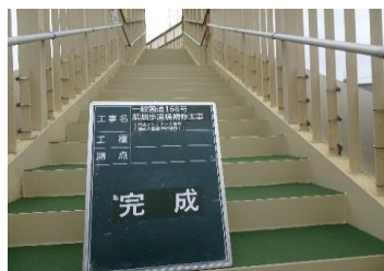
公共工事 歩道橋補修工事