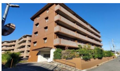
マンション改修工事