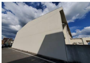
公共工事 外壁改修工事