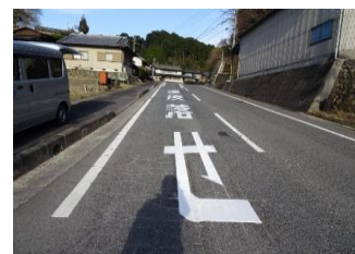
公共工事 区画線工事