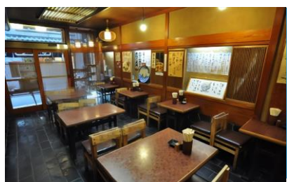
★飲食業★ 蕎麦屋のホール風景