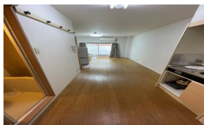
社員寮 ワンルームマンション完備