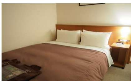
★ホテルの客室清掃★ ベッドメイキング