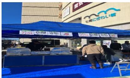
能登半島地震 ボランティア活動