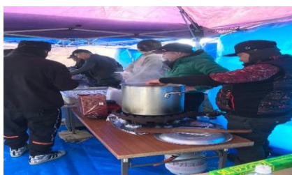
ボランティア活動 炊き出しの様子