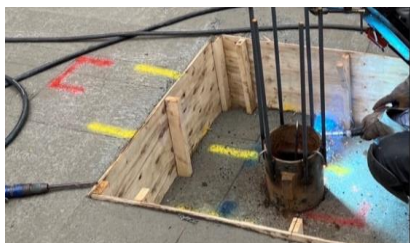
杭頭補強筋 半自動溶接工

働きやすい環境が整っています。遠方からの応募も宿舎を用意しておりますので、お気軽にご連絡下さい。