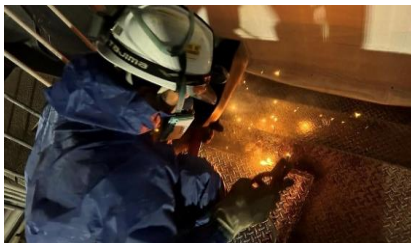
チェッカーPL アーク溶接