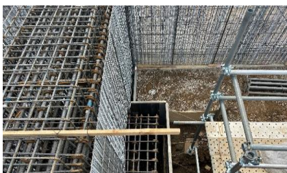
構成型枠ラス工事