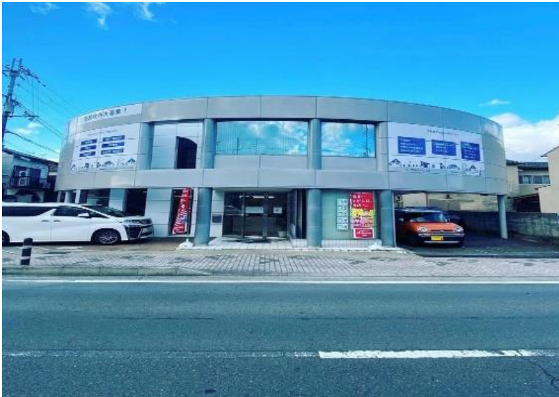
EIGHTコーポレーション京都本社