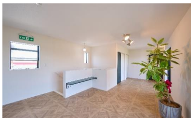
モデルハウス兼事務所