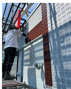
塗装作業中の様子