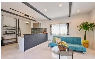
モデルハウス兼事務所