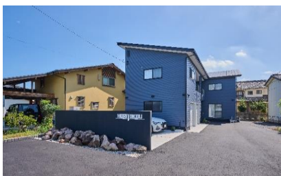
モデルハウス兼事務所

会社や人との「つながり」を大切にしている当社。面倒見がいい社員が多く、新入社員育成にも力を入れています。主力で活躍しているのは、20～30代の若い世代であり、社員同士が認め・信頼しあっており、お互いが切磋琢磨していくことで日々の成長につながっている、人と、会社と一緒に成長できる環境です。