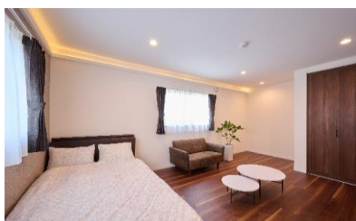
モデルハウス兼事務所