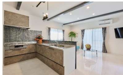
モデルハウス兼事務所