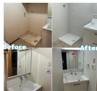
リフォーム工事の様子