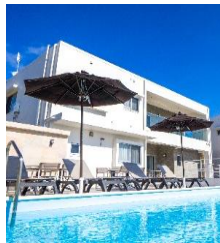
クリスタルヴィラインギャー