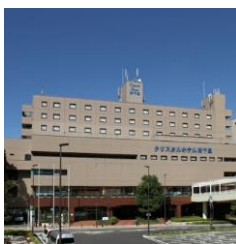
南千里クリスタルホテル