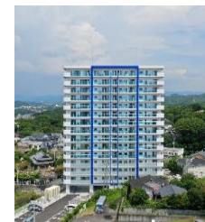
クリスタルエグゼ南紀白浜II