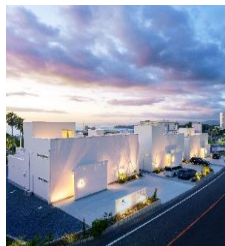
クリスタルヴィラ白良浜ビーチ