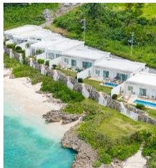
クリスタルヴィラ宮古島砂山ビーチ

お客様に満足して楽しんで頂くために、まず私たちが楽しんで仕事をしていきましょう。