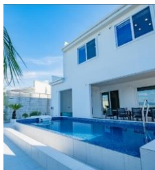
クリスタルヴィラ白浜