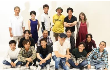
平均年齢32.5歳のメンバーです。