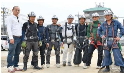
残業なしも夜勤も出張もありません