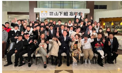
社内イベントも盛り上がります！