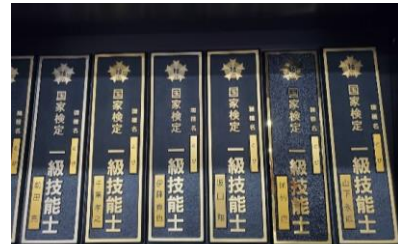
会社負担で一生モノの国家資格取得に挑戦！！