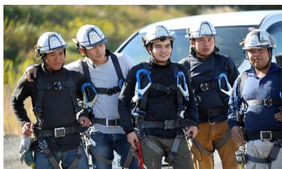
外国人実習生も活躍してます