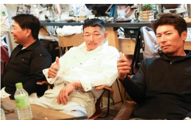
人間関係が良好なのも魅力のひとつ