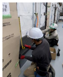
外装工事(サイディング)