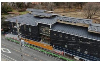
屋根工事(ルーガ瓦)