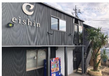
本社(自分たちの仕事でリフォーム)

自分自身、子供時代から、両親に虐待やネグレクトを受けていた。そして家を早く出たくて、高校を中退後、不良のたまり場に顔を出すようになり、自分も少女時代に警察のお世話になりました。しかし、16才のときに働き場所で「ありがとう、とても助かるよ」等、言われたことで、必要とされていると感じ、すごく嬉しく、仕事を頑張るようになりました。人はいつ罪を犯してしまうか解りません。でもチャンスがあり、気付く事が出来れば、気づいた時から変われる。本来持っている良い所を伸ばしあう仲間として、一緒に仕事をしていきましょう。