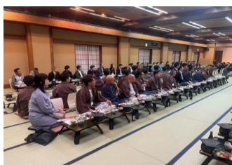
一泊二日の新年会