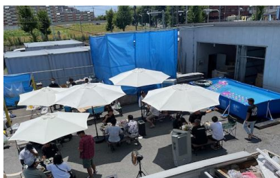
会社の前で本格的プールを出して BBQ