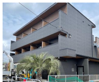
社員寮(自社にて施工)