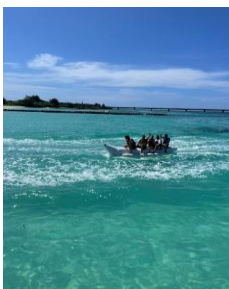
社員研修旅行(沖縄)