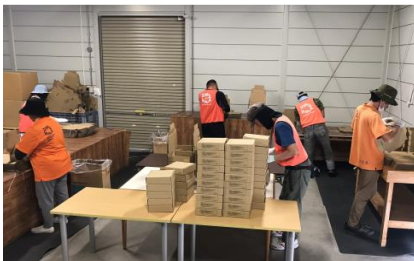
自立準備ホーム 外観