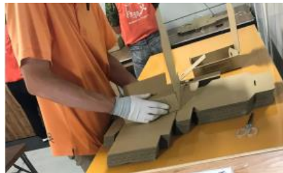
自立準備ホーム 和室