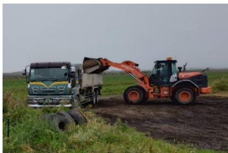
澱粉工場での積込み

本気で人生を変えたい人・犯罪をもう二度と犯さないと強い覚悟を持つてる事こそが当社への採用基準です。