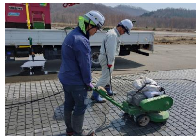
テストコースタイル磨き