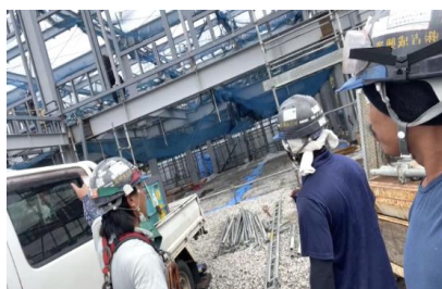
現場着時のミーティングの様子 ※リーダーからの指示で安心安全♪