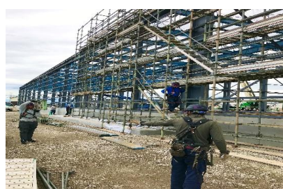
大型物件施工中の様子 ※写真中2名初めての現場の様子♪