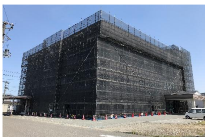
大型物件足場施工完了 ※とても見た目がいいですね♪