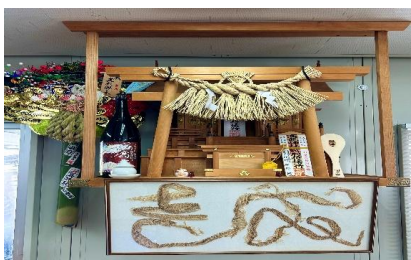
吉成興業の縁起物 1本物の蛇の抜け殻で吉成の文字 ※年始はみんなでお参りに行ってご飯♪