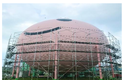
タンク足場施工中の様子 ※足場のプロなのでなんでも出来ます♪