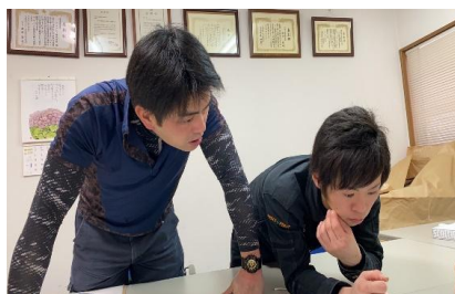
毎朝のミーティングの様子 ※朝から元気を注入♪

人との出会い・縁を大事にする会社です。何の仕事をするかより誰と仕事をするかでこれからの人生は変わります。僕もその一人でした。仕事は真面目に、終われば楽しくをモットーに会社作りをしていますので興味がある方は是非一度お話をしてみましょう！仕事の面では足場の仕事は綺麗事無しで厳しいです。辛いです。ですが誰かがしなくてはいけない誇れる大事な仕事です。その分終わった時の達成感があり、やりがいのある仕事です。体が慣れるまでは相談してください。必ずサポートします！慣れてからは親方になれるように親身に協力します！なので私たちについてきてください！！ 弊社の強みは社員寮が3か月無料で使えますし、体一つで来ても仕事道具は貸与致します。どんな方でも偏見なく話は聞きますのでよろしくお願い致します！