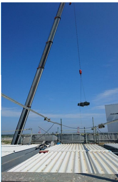
110 t ラフタークレーンでの 足場材荷上げ