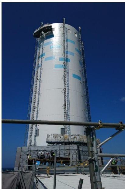
外部ゴンドラの設置