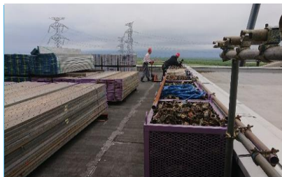
足場材の準備風景