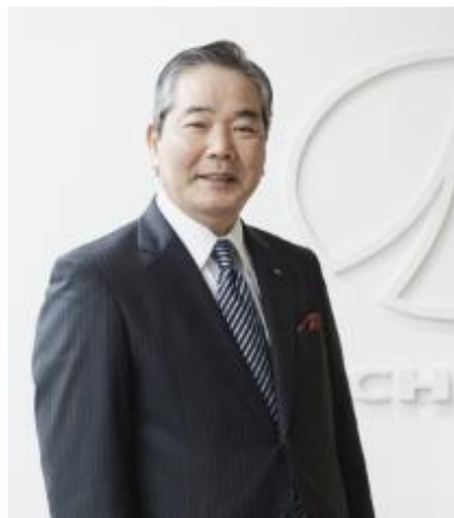
日本財団職親PJ 代表