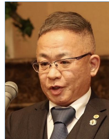
日本財団職親PJ 関東事務局代表