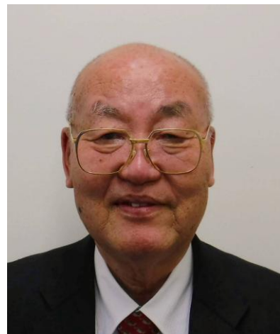
日本財団職親PJ 本部事務局代表 九州事務局代表