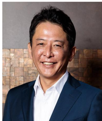
日本財団職親PJ 関西事務局代表